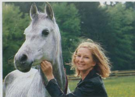
Ein eigenes Pferd – der Kindheitstraum der Drehbuchautorin. Vor einem Jahr ging er in Erfüllung

„Der Preis, den ich zahlen musste, ist gering für das, was ich bekommen habe“